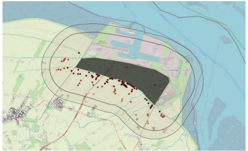
Figuur 1: binnenste ring: 1500 meter tot gebiedsontwikkeling, buitenste ring: 2000 meter tot gebiedsontwikkeling

De Vangnetregeling Oostpolder is ontwikkeld voor bewoners rondom de Oostpolder. Het gebied waarop de Vangnetregeling Oostpolder van toepassing is ligt op 1.500 meter van de buitenste rand van de gebiedsontwikkeling Oostpolder. Ook binnen 2.000 meter geldt dat bewoners mee mogen doen, wanneer er direct zicht is op het plangebied vanuit de woonkamer of keuken van de woning. (zie afbeelding)