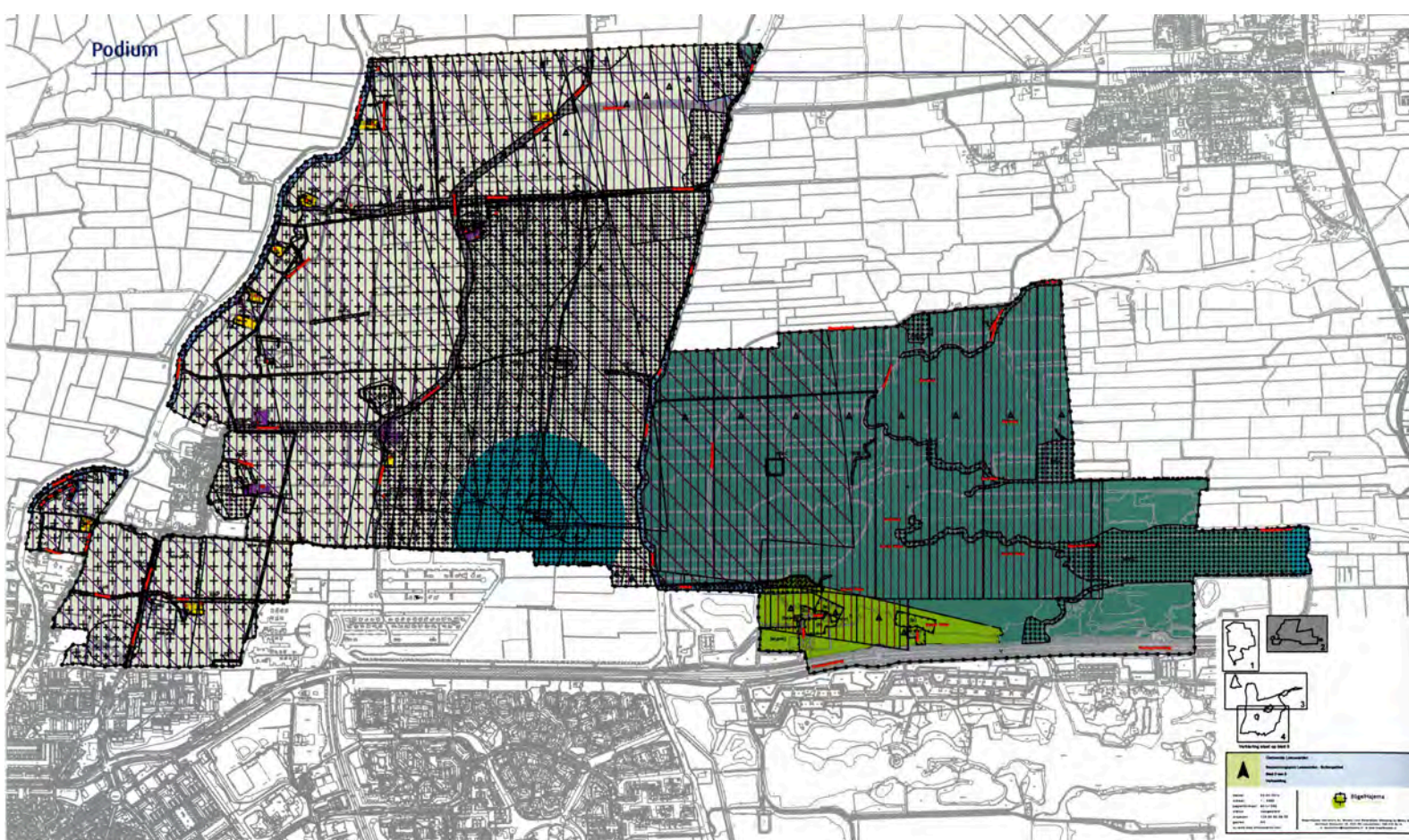
Bestemmingsplan en planMER gelijktijdig opgesteld