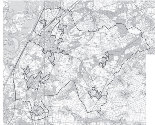
Plangebied bestemmingsplan buitengebied Echt - Susteren

Echt – Susteren is een gemeente in de provincie Limburg. De gemeente Echt – Susteren wil haar geldende bestemmingsplannen voor het buitengebied herzien tot één nieuw, digitaal en actueel bestemmingsplan buitengebied. Het bestemmingsplan zal met name conserverend en behoudend van aard zijn. Slechts kleinschalige ontwikkelingen worden mogelijk gemaakt, waaronder uitbreidingsmogelijkheden voor intensieve veehouderijen. Het plangebied betreft het buitengebied exclusief het Grensmaasgebied ten westen van het Julianakanaal.