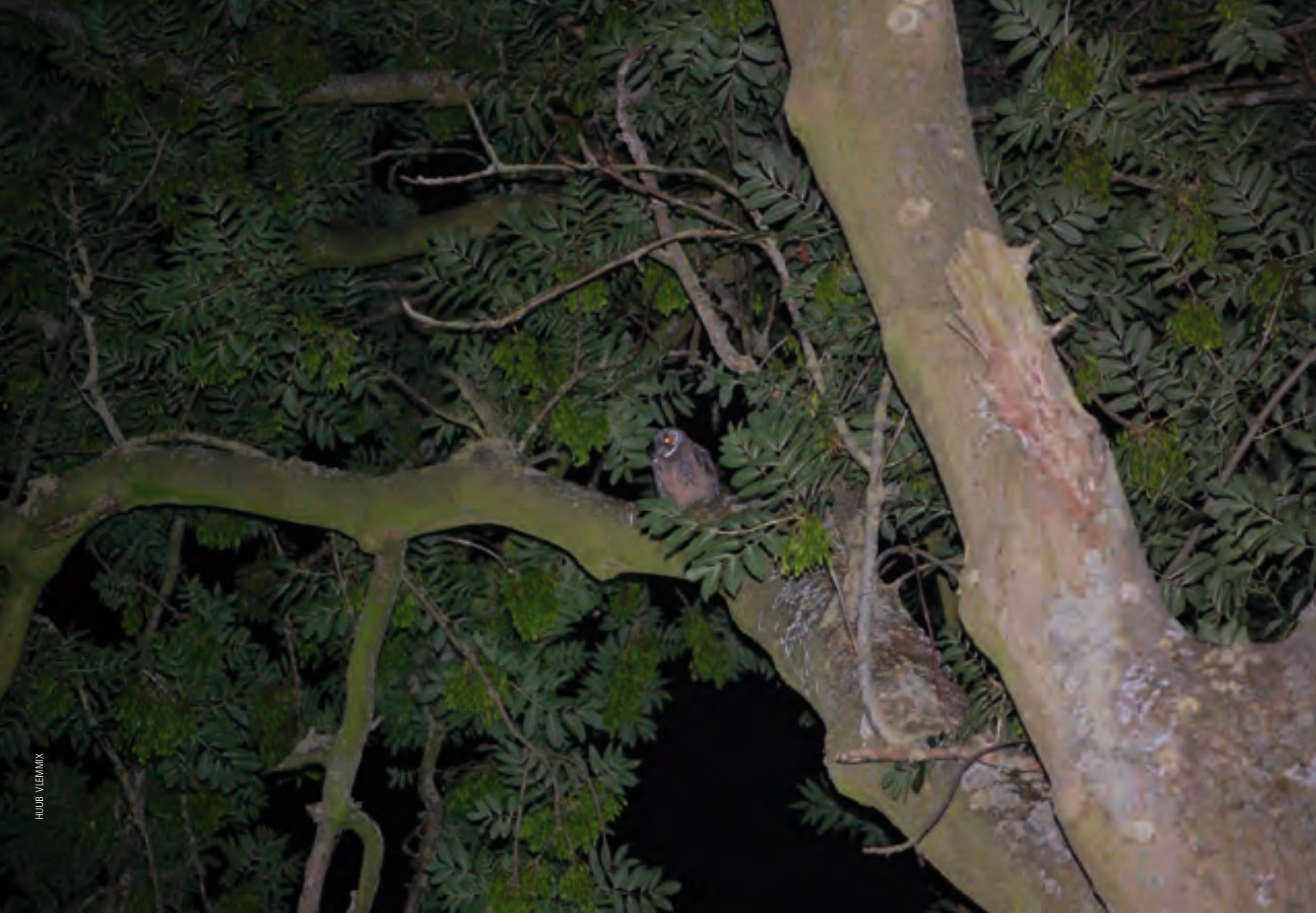
Jonge ransuil in gewone es.

deel van de vogeltrek plaatsvindt (september tot en met april). Het optreden van effecten op vogels bij lagere lichtsterktes is op dit moment onzeker. Vogels kunnen op hun route in een lichtgloed terecht komen en raken dan door de uitval van hun magnetisch kompas gedesoriënteerd. Alterra vermeldt dat de drempel voor dit effect, op basis van de lichtgevoeligheid van de ogen van vogels en bij risicoverhogende omstandigheden (zoals weinig achtergrondverlichting, slecht zicht en laaghangende bewolking), zeer laag kan zijn; wellicht lager dan 0,1 lux. Kwantitatieve gegevens over de drempelwaarde zijn er weliswaar niet, maar in een Noord-Amerikaans experiment is waargenomen dat lichtgloed met een sterkte van afgerond 0,001 lux al een significant effect heeft op de oriëntatie van eerstejaars witbekroonde mussen ( Zonotrichia leucophrys ). Uit experimenten blijkt dat vooral jonge vogels zich sterk richten op een lichtgloed.